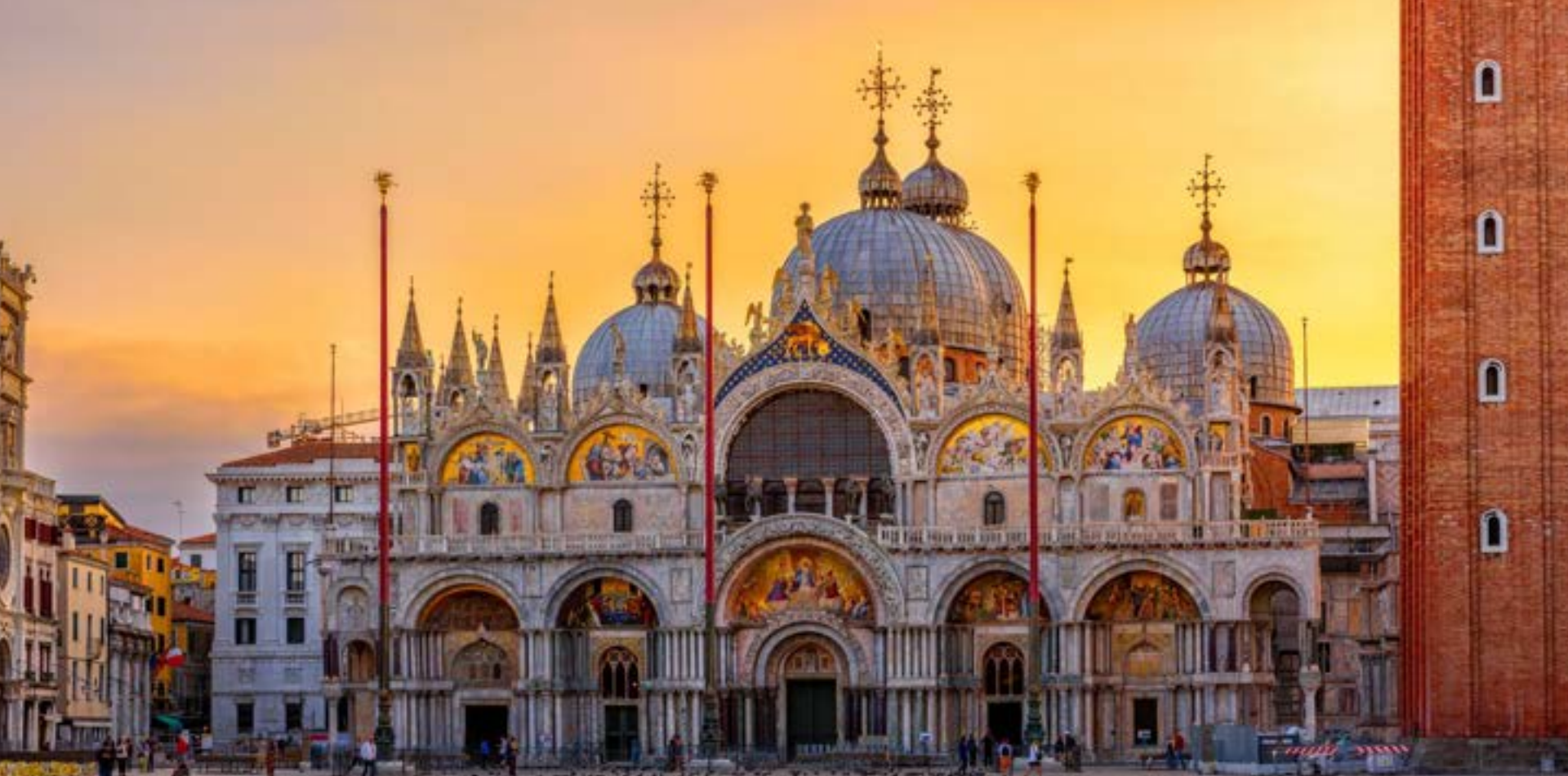
Basílica de São Marcos em Veneza